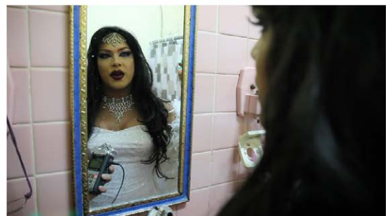
Cubanos entrevistados sobre la caída del bloqueo para la página web del largometraje.