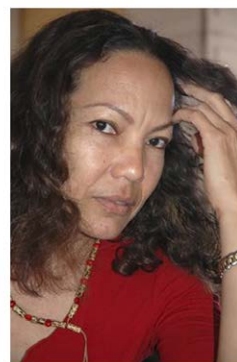
Reuniones del productor ejecutivo y guionista con los aspirantes a protagonizar el largometraje (precasting).